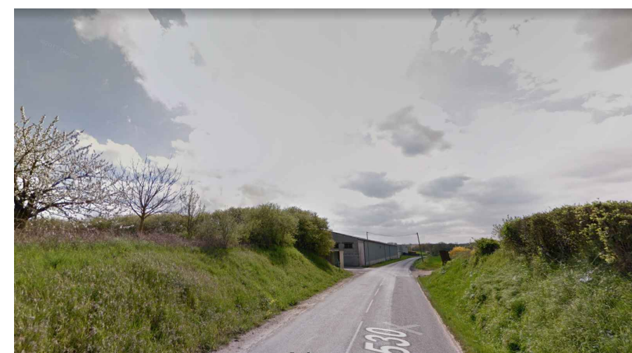
ANNEXE 3 - 2 - PHOTOGRAPHIE PROCHE